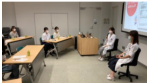
研究者の方との交流会