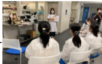
研究所の中も見せていただきました