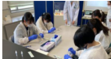
実際に検査キットを使いました